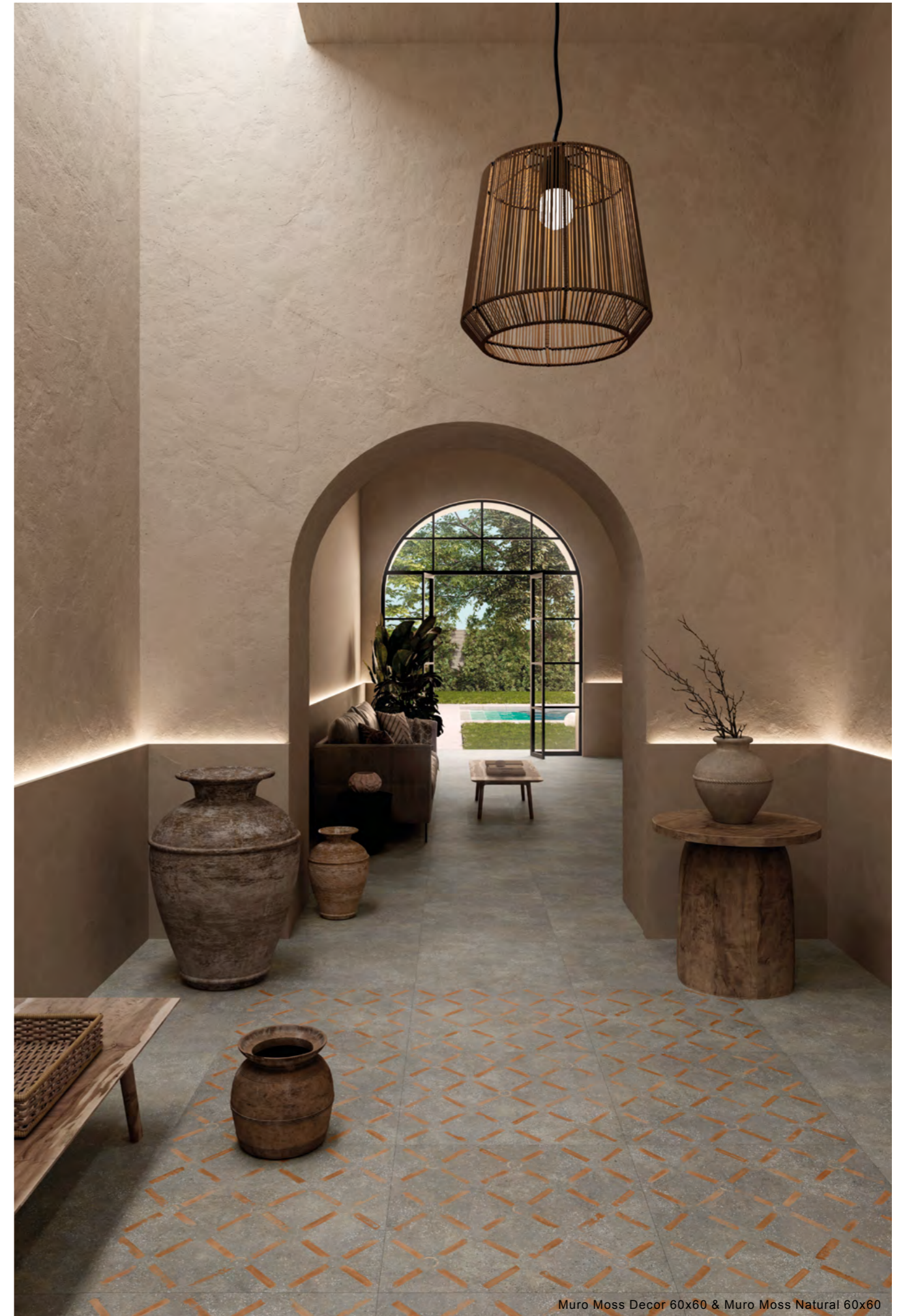
Muro Moss Decor 60x60 & Muro Moss Natural 60x60