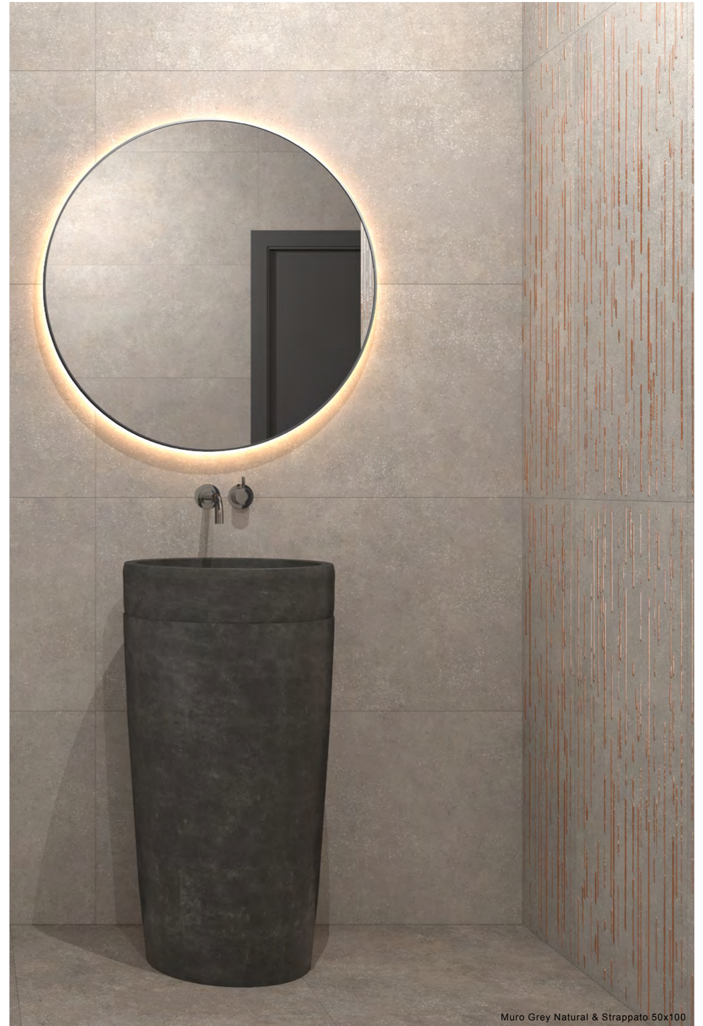
Muro Grey Natural & Strappato 50x100